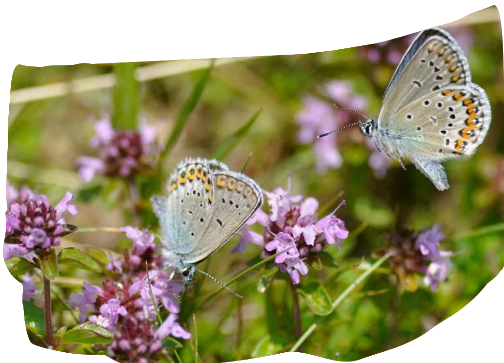
AZURÉ DU GENÊT PLEBEJUS IDAS

Remarque : aucune grande randonnée n'est programmée, mais une bonne forme physique est conseillée (dénivelé positif maximum sur une journée : 400 m). Nous progresserons toujours lentement pour observer les animaux et leurs habitats chemin faisant, mais tout ça se déroulera sur des sentiers de montagne et parfois même légèrement hors-sentier.