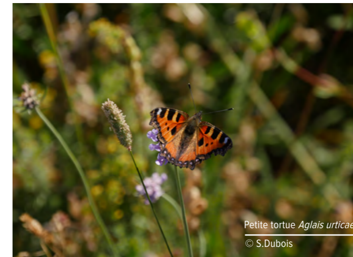
Petite tortue Aglais urticae